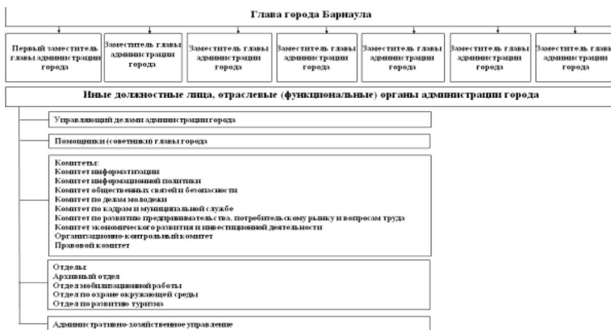
Рисунок 1 – Структура администрации г. Барнаула

Структура администрации г. Барнаула утверждается Барнаульской городской Думой по представлению главы администрации города. Действующая структура администрации города Барнаула утверждена решением Барнаульской городской Думы от 3 июня 2011 года № 548 [7] и представлена на рис.1 [9].